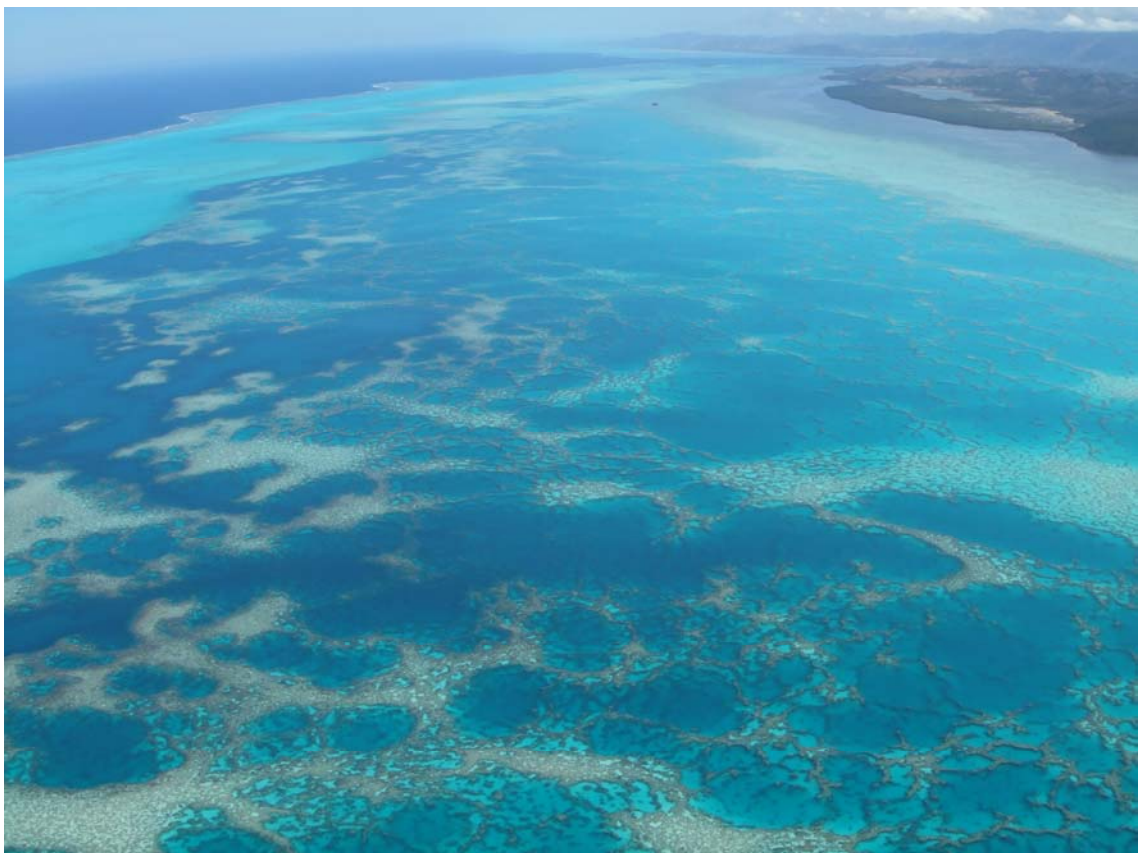
New Caledonia coral reefs: © Dan Laffoley/IUCN